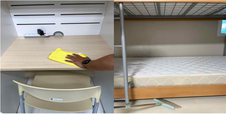
책상, 옷장, 침대 밑 먼지 제거