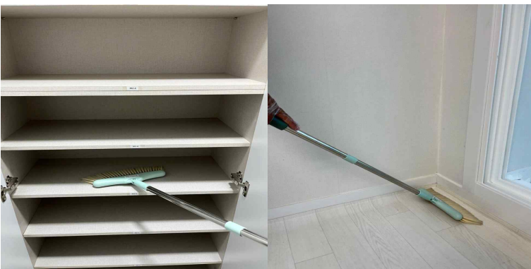
현관 입구 및 신발장 정리, 호실 바닥(주방, 거실, 베란다, 세탁실) 먼지 제거