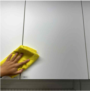
수납장 외부 오염 제거