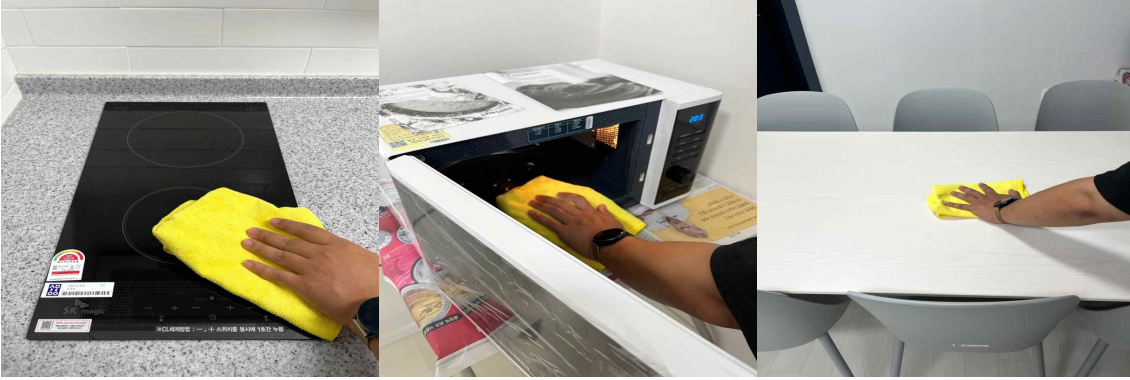
인덕션 및 전자레인지 음식물 오염 제거, 공용식탁 사용 후 청결 유지