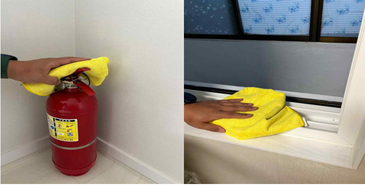
소화기, 창틀 먼지 제거