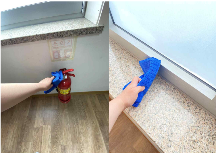
소화기, 창틀 먼지 제거