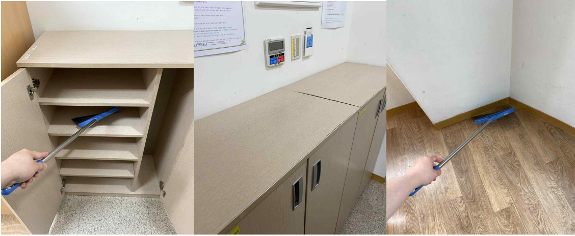
신발장 청소 및 물품 정리, 호실 바닥 먼지 제거